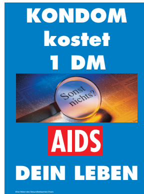
Bayer. Staatsmin: Plakat- "AIDS" Kondom kostet...