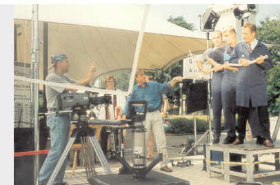
Fa. AH BMW-Paul SPAETT: Spot Motiv : "für Sie ziehen wir alle..."