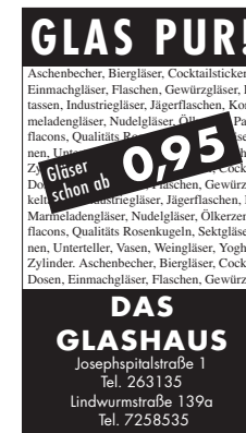
Fa. Das GLASHAUS: CI/CD Anzeigen zb.Motiv: "Glas pur !"