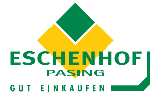
Fa. Eschenhof Center: CI/CD "Wir freuen uns auf Sie..."