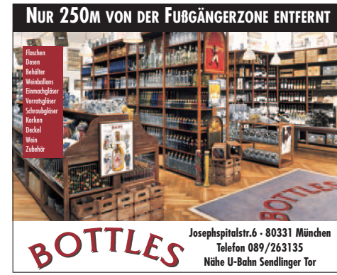
Bottles: Anzeigen PRINZ Image