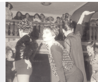
Friseurinnung München: 3 Jahre lang Abendfachveranstaltungen imMetropolis und im Circus KRONE in München. Moderation, Bühne, Licht- und Tontechnik mit je Veranstaltung ca. 1.500 Fachbesuchern.